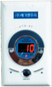
Digital Termostat 4 kW( max)

EN EKONOMİK... Tam gün çalışmaz. Namaza 5 dakika kala açılması halıların ısınması için yeterlidir. Günde en çok 1 saat devrede kalır.